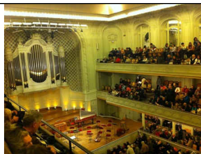
Concert salle Gaveau