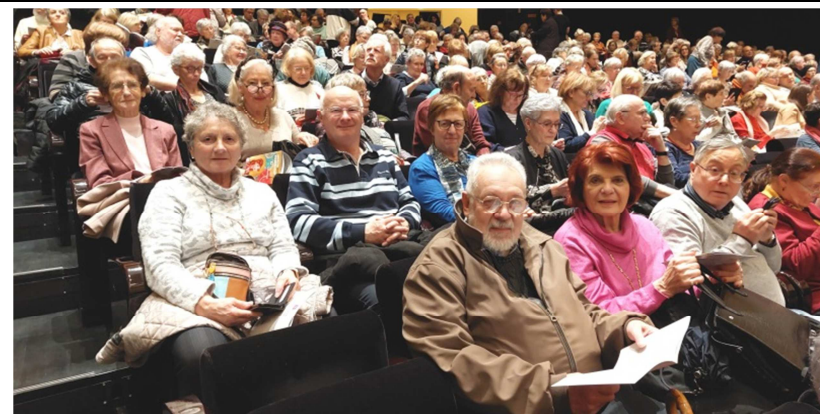
Philharmonie, les Seniors