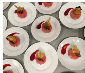
Composition du traiteur Abeille Royale