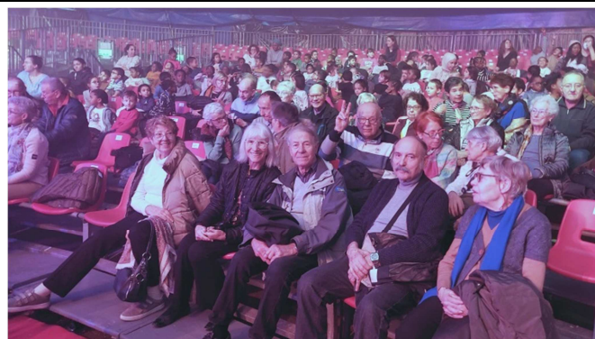
Cirque de Massy, les Seniors