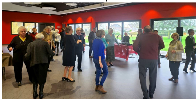
Repas Saint Valentin