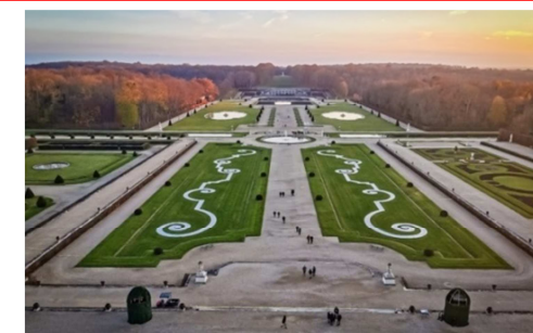
Le parc, immense mais en voiturettes électriques